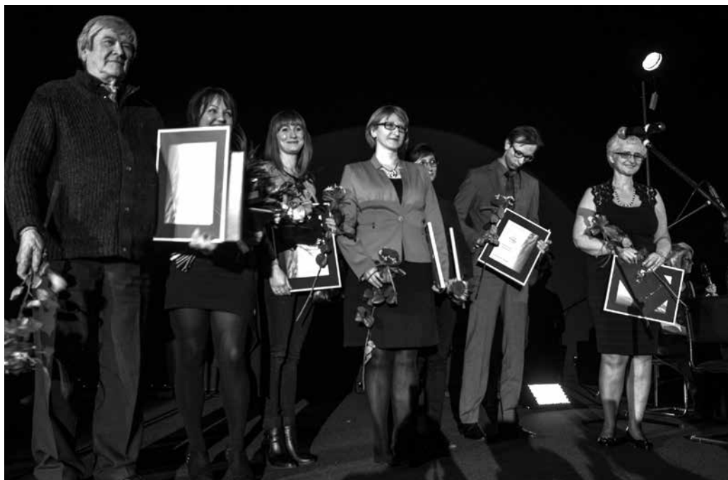
Laureaci LWL 2015

Chciałbym pogratulować nagrodzonym, podziękować uczestnikom i sponsorom oraz zaprosić do udziału w przyszłorocznej edycji konkursu. Mamy nadzieję, że nasz wspólny wysiłek w promocję regionu lubuskiego oraz propagowanie czytelnictwa będzie miał wymierne korzyści dla nas wszystkich.