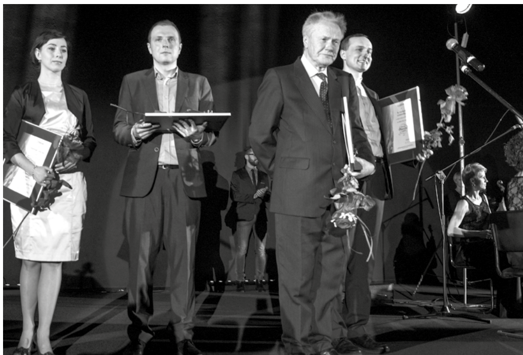
Laureaci LWN 2015